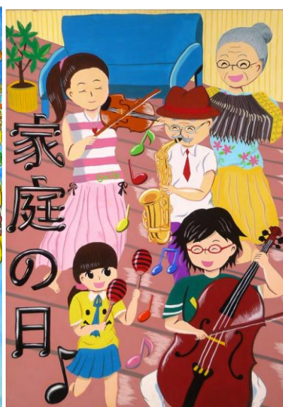
生徒の部 入選作品