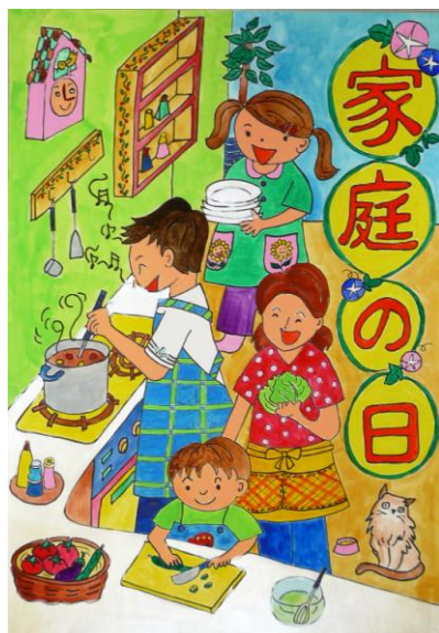
児童の部 特選作品