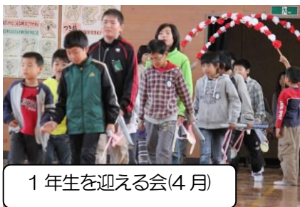
1年生を迎える会(4月)