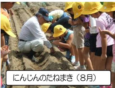
にんじんのたねまき(8月)