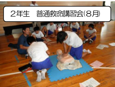
2年生 普通救命講習会(8月)