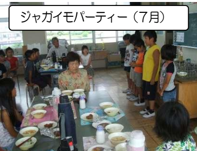
ジャガイモパーティー(7月)