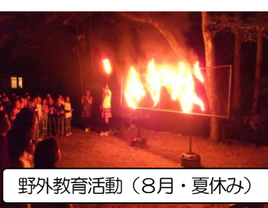
野外教育活動(8月・夏休み)