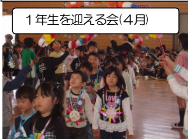
1年生を迎える会(4月)