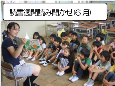
読書週間読み聞かせ(6月)