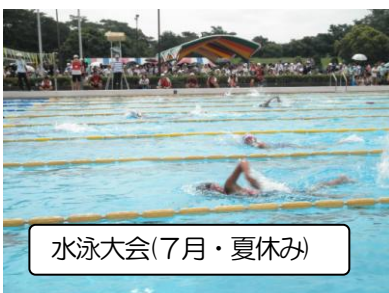
水泳大会(7月・夏休み)