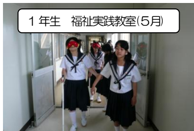
1年生 福祉実践教室(5月)