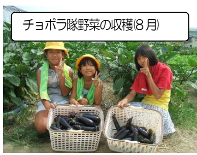
チョボラ隊野菜の収穫(8月)