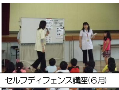
セルフディフェンス講座(6月)