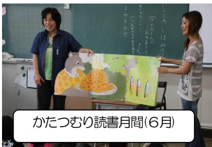
かたつむり読書月間(6月)