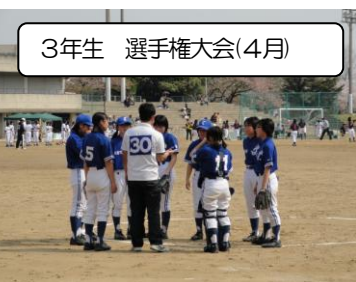
3年生 選手権大会(4月)